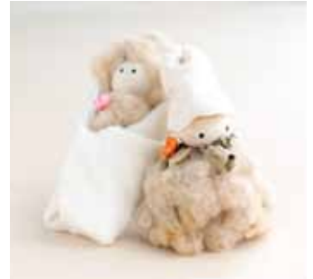
フクシマオーガニックコットンベイベ