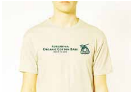
フクシマオーガニックコットンTシャツ (2013年6月発売)